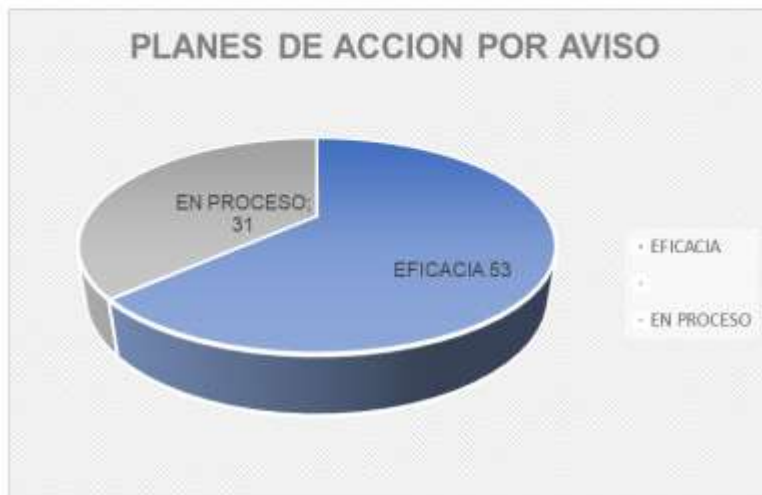
Tabla No.11 Fuente archivo de Excel "Matriz Control Tercer trimestre 2021" OCI

Con el fin de aportar al mejoramiento continuo de la entidad, la Oficina de Control Interno programó en su PAA 2022 un seguimiento adicional a la gestión de riesgos en la próxima vigencia, en aras de alertar a los procesos de la posible materialización de riesgos con referencia a los resultados obtenidos en los seguimientos realizados en el semestre.